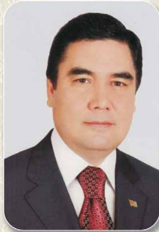
Qorban Ali Berdi Mohamedov Turkmenistan President

Answer: Thank you, with regards to readers of monthly magazine, I have to say: To day's conference is celebrate with endless efforts of Turkmenistan President and participation of representative from United Nations and representatives from 30 countries around the globe which includes from East to West and from North to South.